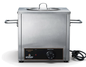
VISTA 3/4 · MANTENEDOR CHOCOLATERA 1 CILINDRO