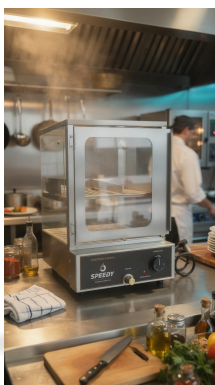
VISTA 3/4 · PANCHERA A VAPOR