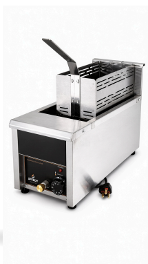
VISTA 3/4 · FREIDORA 8 LITROS