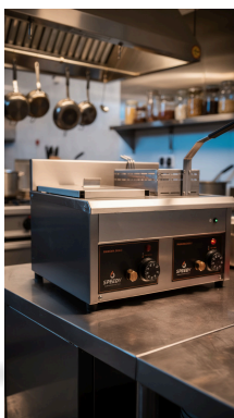
VISTA 3/4 · FREIDORA DOBLE 16 LITROS