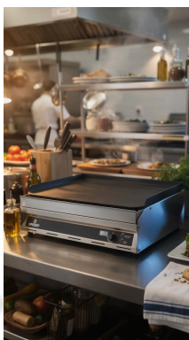
VISTA 3/4 · PLANCHA 30X40