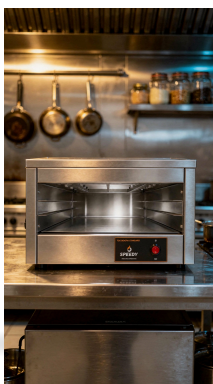
VISTA 3/4 · TOSTADORA ESTÁNDAR