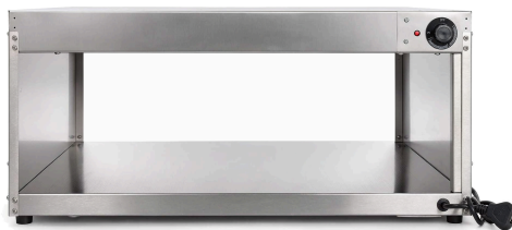
VISTA 3/4 · PASA PLATOS 8 PLATOS