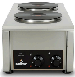
VISTA 3/4 · ANAFE ELÉCTRICO PRO 26 KW C-U