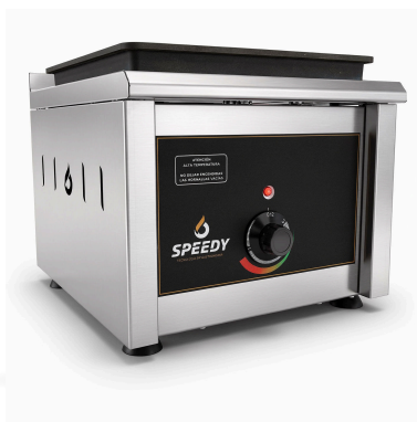
VISTA 3/4 · ANAFE ELÉCTRICO 1 HORNALLA 25 KW