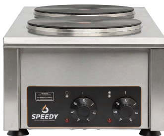
VISTA 3/4 · ANAFE ELÉCTRICO 2 HORNALLAS 1,5 KW C/U