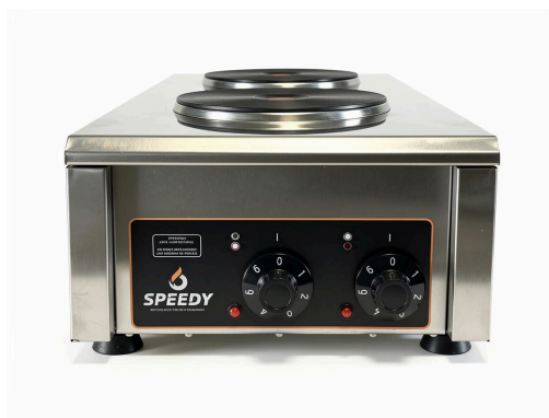
VISTA 3/4 · ANAFE ELÉCTRICO 2 HORNALLAS 25 KW