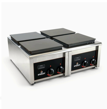
VISTA 3/4 · ANAFE ELÉCTRICO 4 HORNALLAS 25 KW