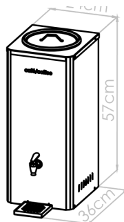
DIAGRAMA TÉCNICO · COTAS EN CM