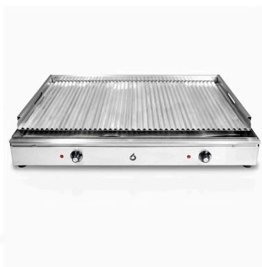
VISTA 3/4 · PARRILLA CON TAPA ACANALADA G